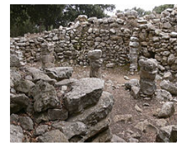
Les Païsses (Artà)