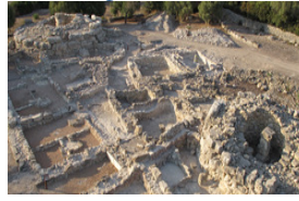
Son Fornés (Montuïri)