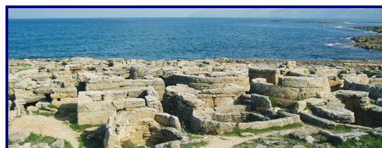
Son Real, la necròpolis més important de l'illa

Entre els elements arquitectònics talaiòtics, també cal esmentar les construccions de caràcter funerari com les necròpolis (cementiris) a l'aire lliure.