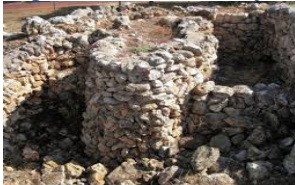
L'illot (Sant Llorenç)