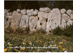
Els Rossells (Felanitx)

Entre els elements arquitectònics talaiòtics, també cal esmentar les construccions de caràcter funerari com les necròpolis (cementiris) a l'aire lliure.