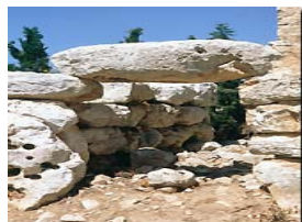
Els Antigons (les Salines)