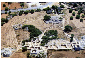
Capocorb Vell (Lluçmajor)

Els poblats talaiòtics de Mallorca més ben coneguts, i en part excavats, són els següents: